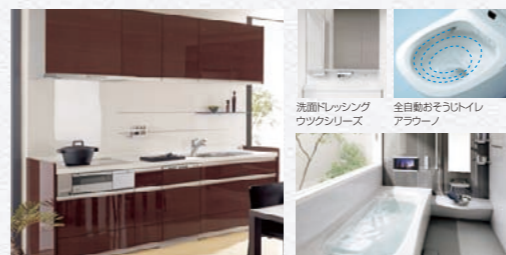
リビングステーション Sクラス ココナー Sクラス

主な設備は、最新のパナソニック製品を採用。 ゆとりの暮らしが始まります。 先進の機能とデザイン性がマッチしたパナソニックの設備は、自分の好みに合わせてカラーをコーディネートできる日々の暮らしが楽しくなります。